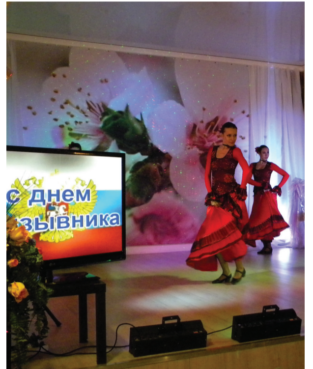
Для призывников организаторы постарались провести яркий и запоминающийся концерт

идти, уже прошло – служба сейчас для большинства престижна. В подтверждение этого мама одного из призывников призналась, что ее сын, получив диплом о высшем образовании, заявил, что сначала хотел бы отслужить, а уж потом устраиваться на работу.