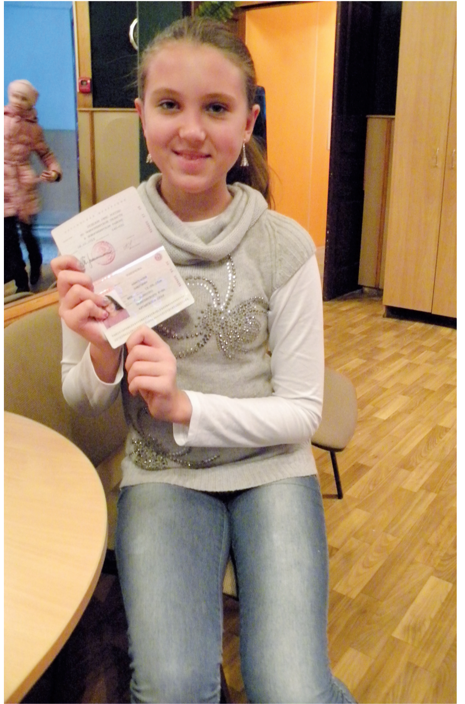
Паспорт для подростков стал не просто официальным документом, а символом вступления во взрослую жизнь

31 октября в Центре культуры Новосибирского района «Сибирь» прошло очень важное и значимое событие — несколько десятков подростков в торжественной обстановке получили первые в своей жизни паспорта