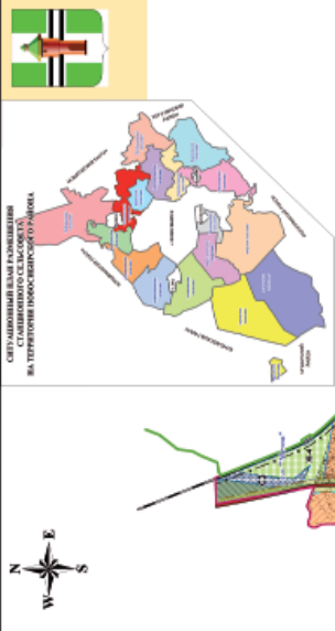
СХЕМА ГРАДОСТРОИТЕЛЬНОГО ЗОНИРОВАНИЯ СТАНИОННОГО СЕЛЬСОВЕТА, НОВОСИБИРСКОГО РАЙОНА, НОВОСИБИРСКОЙ ОБЛАСТИ МАСШТАБ 1 : 20 000

Приложение 2 к решению Совета депутатов Станционного сельсовета Новосибирского района Новосибирской области № ___ от _____ 2012 г.