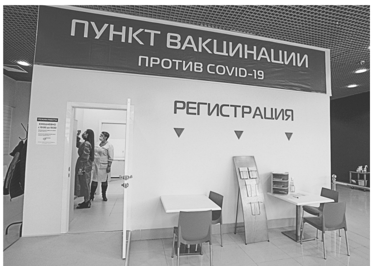
5. Фото «вакцинация»