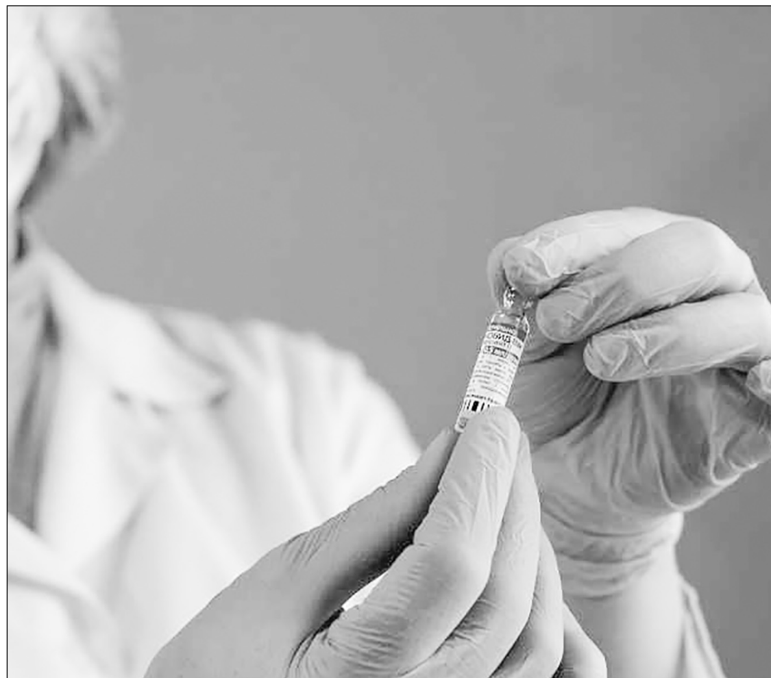
Под постановление об обязательной вакцинации в Новосибирской области подпадает более 270 тысяч человек