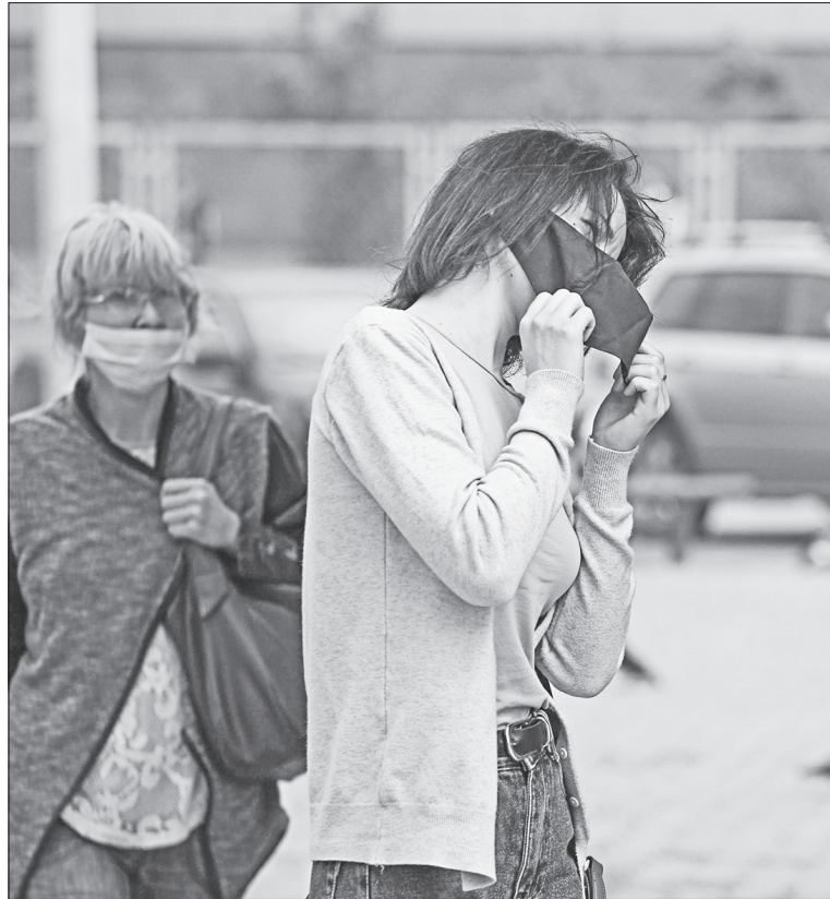
Медики напоминают: носить маски и соблюдать другие меры профилактики от коронавируса необходимо даже тем людям, которые уже сделали прививку от COVID-19

По известным данным, люди после вакцинации болеют