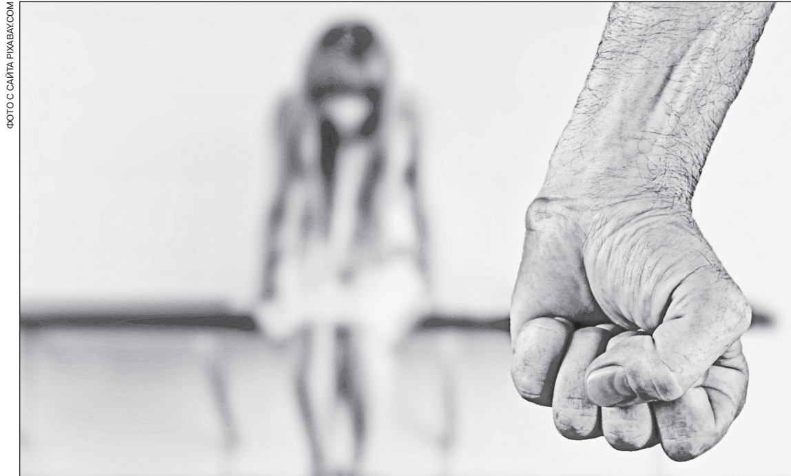
В Новосибирской области более 5,5 тысячи семей находятся в статусе неблагополучных. За такими семьями закрепляется куратор, который взаимодействует с конфликтующими сторонами

— Когда человек приходит на прием с жалобами на депрессивное состояние и нежелание