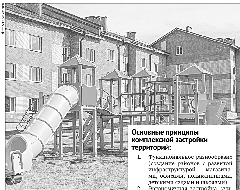
Среди основных принципов комплексного жилищного строительства — развитая инфраструктура, безопасность и здоровье