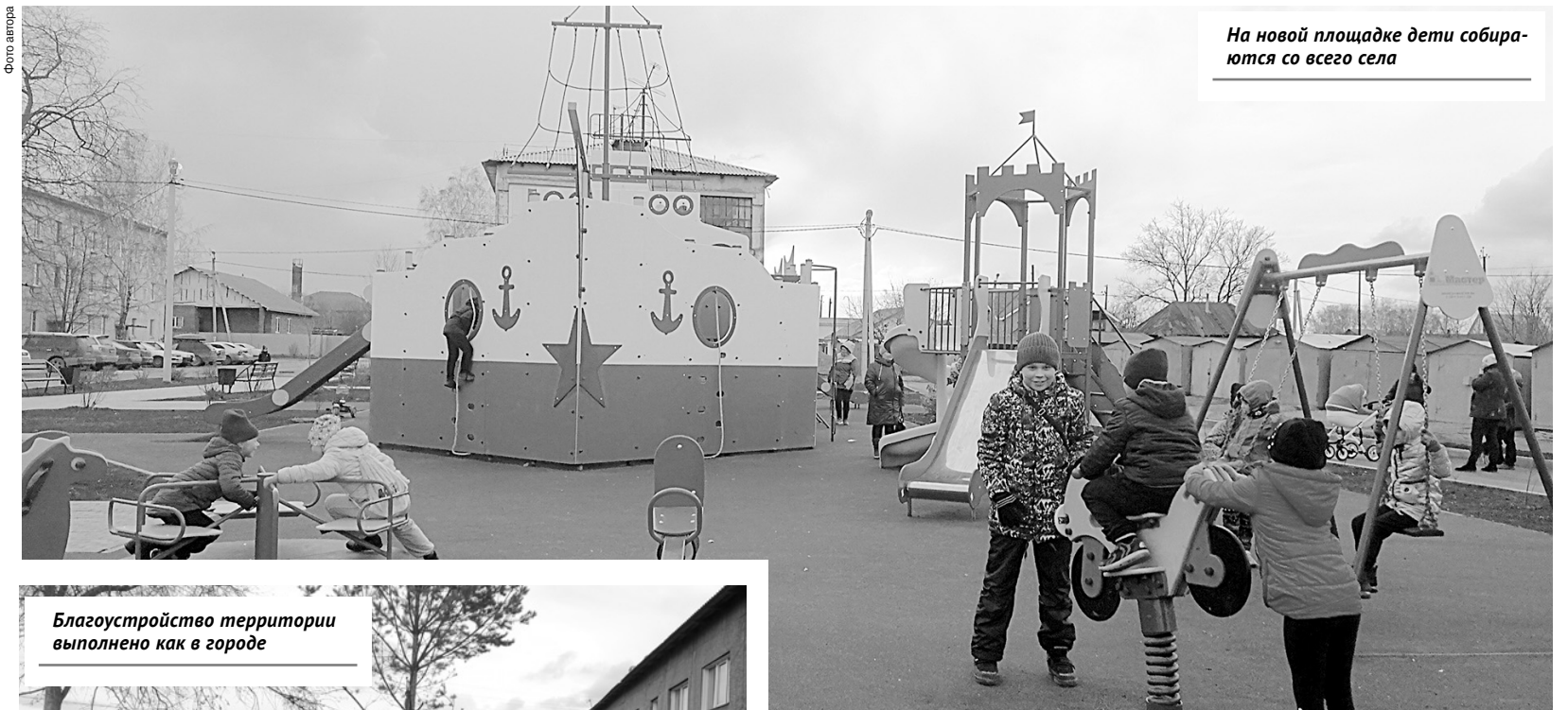
На новой площадке дети собираются со всего села