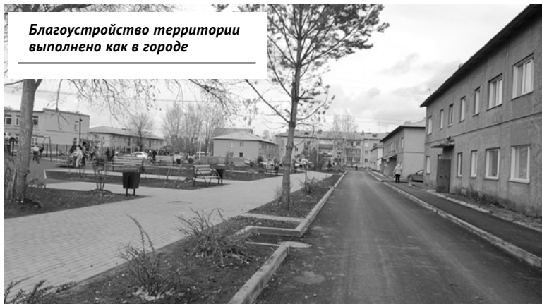
Благоустройство территории выполнено как в городе

территория вокруг многоквартирных домов № 9, 10, 11, 12 на улице Жилмассив. Жители говорят, что им повезло: их дома попали в федеральную программу «Благоустройство дворов», по приоритетному проекту «Формирование комфортной городской среды» было выделено более шести миллионов рублей. На проездах вокруг домов и тротуарах появилось новое асфальтовое покрытие, есть парковка для машин, установлено освещение. Сейчас никакой ливень не страшен — вода быстро уйдет в водоприем-