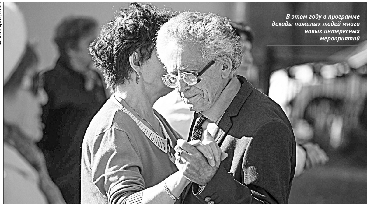
В этом году в программе декады пожилых людей много новых интересных мероприятий

Во всех муниципалитетах Новосибирской области людей «серебряного» возраста поведут к активному долголетию по «тропе здоровья». В министерстве труда и социального развития региона говорят, что главная цель этой акции — уделить внимание пожилым гражданам и показать им, как правильно заботиться о своем здоровье с помощью занятий