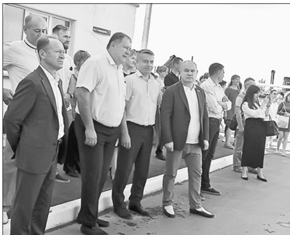
Новый двор в Раздольном стал праздником для всех. Поздравить местных жителей приехали почетные гости из Новосибирска