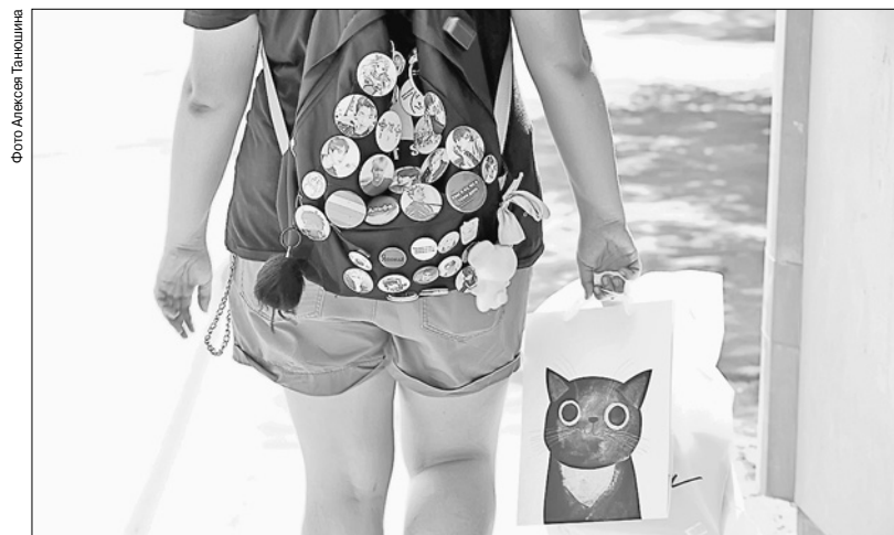
Пандемия не мешает сибирякам быть оптимистами

Большинство наших соотечественников считают, что в первую очередь государство должно помогать семьям с детьми. На второе место вышла забота о старшем поколении, на третье — доступная медицинская помощь, профилактика и равные возможности получения образования. Эксперты говорят, что нацпроекты в России совпадают с пожеланиями населения. Генеральный