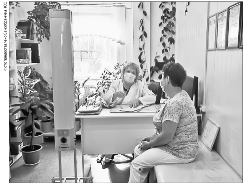
В новом ФАПе жители деревни Издревая могут получить квалифицированную медицинскую помощь

Народные избранники также побывали в селе Новолуговое, в котором проживают более пяти