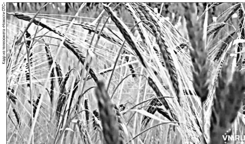
При помощи меланина растения общаются между собой

— Ячмень — он самоопылитель, он скрещивается сам с собой. Но если вы хотите вести селекцию, получать гибриды, вводить нужные признаки в ваши сорта, вы должны искусственно вести скрещивание. В итоге и фиолетовый ячмень получили, и черный, и даже альбинос — вообще без окраски.