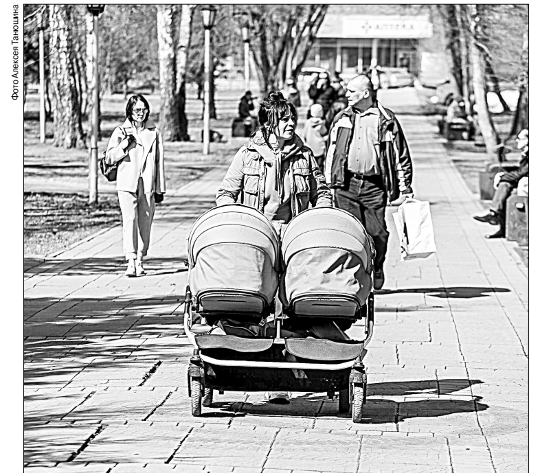
Большинство российских семей уже получили главную «коронавирусную» выплату

5. Единовременное дополнительное пособие при рождении ребенка в молодой семье в размере 6000 рублей на первого ребенка, 12000 рублей — на второго; 18000 рублей на третьего и последующих детей.