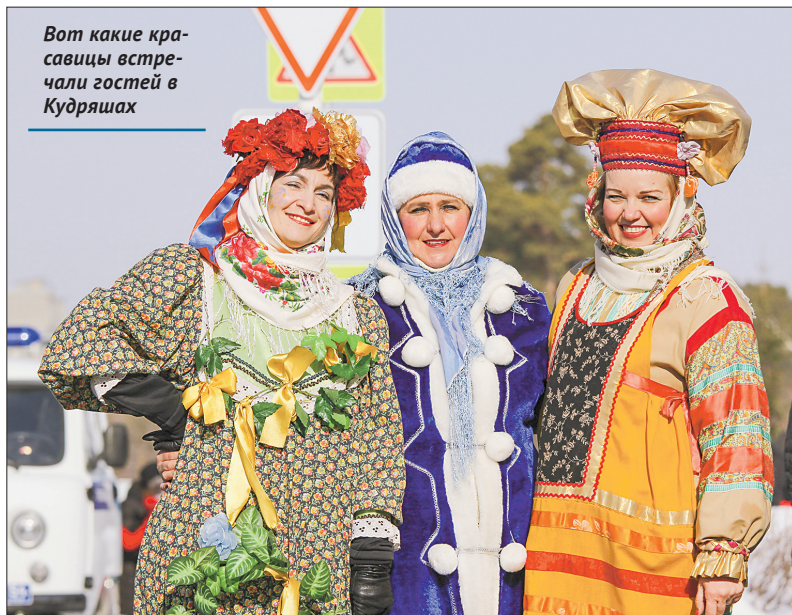
Вот какие красавицы встречали гостей в Кудряшах

Кульминацией праздника стал традиционный обряд, который