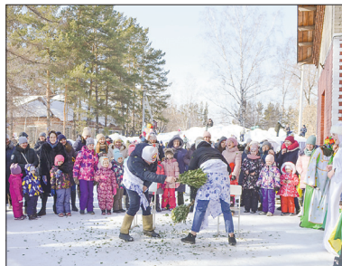
В Садовом парили друг друга венками

ждут все — сожжение чучела Масленицы, символизирующего обычно зиму: «Мы чучело Масленицы сжигаем, грусть-тоску разгоняем! Улетай, грусть-тоска, с веселой песней в облака!»