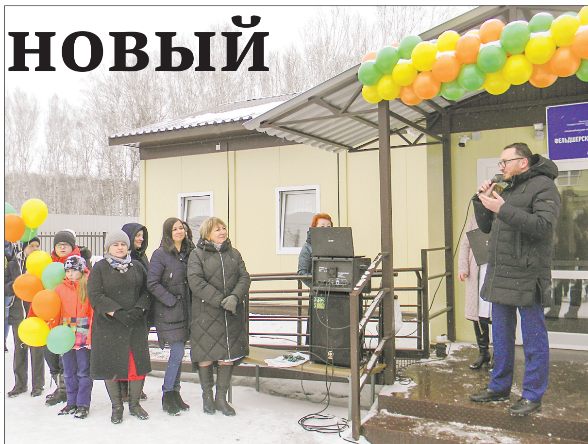
Открытие ФАПа в Издревой для жителей стало настоящим праздником

Как отмечали организаторы мероприятия, именно депутатам принадлежит немалая часть заслуги в том, что такие ФАПы повсеместно открываются в районе и регионе, поскольку именно народные избранники «инициируют» вопросы по их строитель-