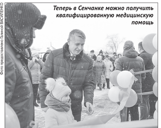
Теперь в Сенчанке можно получить квалифицированную медицинскую помощь

Сразу после официальной части гости смогли оценить оснащённость учреждения. В новом ФАПе есть смотровой, прививочный и процедурный кабинеты, стерилизационная, помещение для хранения медицинских препаратов, кабинет для приёма, комната персонала. В ФАПе будет удобно и маломобильным гражданам, ведь при его строительстве было учтено всё необходимое для этого. Кроме того, в новом пункте есть и жильё для фельдшера.