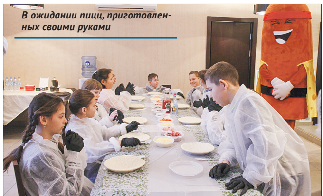
В ожидании пиццы, приготовленных своими руками