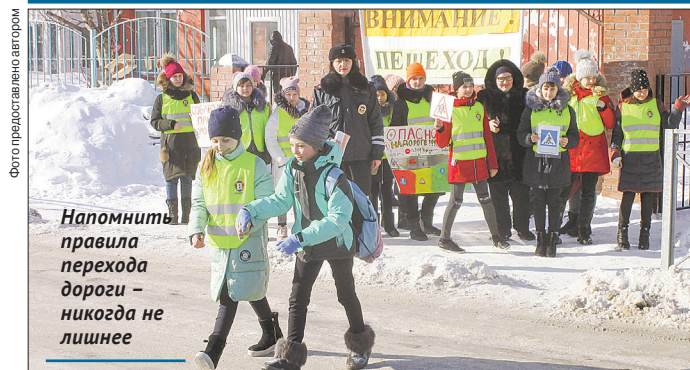
Напомним правила перехода дороги – никогда не лишнее