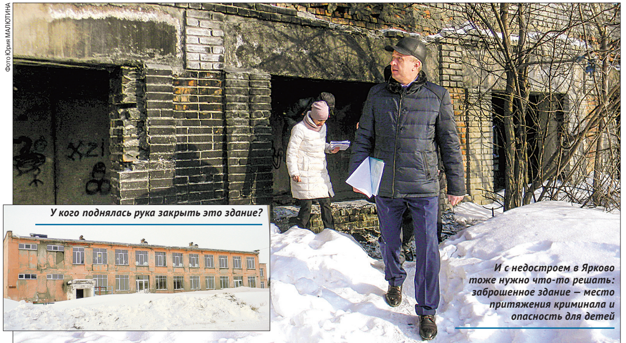
У кого поднялась рука закрыть это здание?

– Первое, что хочется сказать по ряду моментов... Безобразие, конечно, то, что я сегодня увидел в больнице; сказал коллегам-корреспондентам сделать фотографии, и в ближайшее время постараюсь с первым замгубернатора, который курирует медицину, обсудить эту проблему. Далее мы будем говорить о строительстве (новой больницы), но первое, что необходимо сделать, – это срочно менять здесь крышу и провести ремонт. Ну что это такое? Тапки стоят... 21-й век – а мы не можем решить простую задачу... В этом году надо заходить на крышу и делать косметический ремонт; я постараюсь обострить эту проблему; письмо в любом случае в ближайшие дни на имя главврача я подготовлю. По жилищному фонду у меня есть вопросы, в том числе и к вам, Сергей Александрович: почему не признаются дома аварийными? Почему не инициируете мероприятия по включению домов в программу расселения людей из ветхого и аварийного жилья? Программа работает достаточно хорошо по территории области – это федеральные средства. От вас требуется собрать пакет документов, признать дом аварийным и зая-