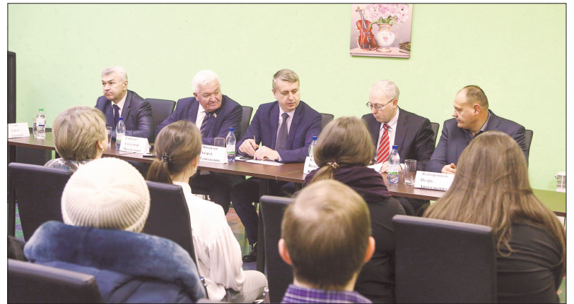
Вопросов к власти и местного, и районного уровня у жителей накопилось немало

К слову, школа в Ленинском работает как многофункциональный центр – за неимением ДК, здесь проходят сельские праздники и мероприятия.