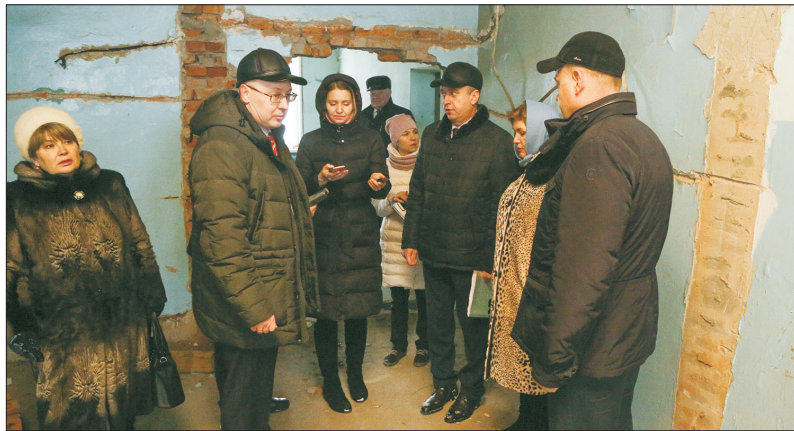
Очередной подрядчик ушёл с ремонта ДК в Ленинском, освоив всего 10% средств, да и то с ненадлежащим качеством

Далее делегация проследовала в Дом культуры села Ленинское. Вернее, в то, во что превратилось здание после многих лет якобы ремонтов. В ДК, расположенном в замечательном месте и красивом здании, случился парадокс: ремонты всё идут, деньги всё выделяются, а ситуация не только не улучшается, а становится хуже. В последний раз, например, в прошлом году на этот объект было выделено 5 млн 300 тыс. рублей. Пришел новый подрядчик, который взялся