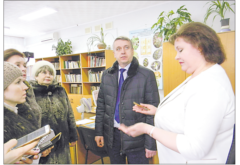
Районной СЮН, как и многим другим организациям, не хватает тех помещений, в которых они расположены

Переезд в Мичуринский сельсовет был как попадание в другую реальность, с которой мы уже встречались в других наших поселениях, причём не ближних (по отношению к городу), а в дальних. А ведь, заметим, мичуринская территория – вторая по налогооблагаемой базе в Новосибирском районе, сельсовет – профицитный (доходы преобладают над расходами), и люди давно, по идее, должны были бы жить в условиях «максимально приближенных к городским», как и краснообцы. Но пока не живут. Речь идёт, в первую очередь, о здравоохранении. Сравнение ярковской амбулатории и мичуринской (расположенной на третьем (!) этаже административного здания) напрашивалось само собой. Почти те же самые вопросы к мнздраву – как такое может быть – в смысле условий – в 21 веке? Культура, правда, куда в лучшем состоянии, чем в Ярково: достаточно вместительный ДК (экскурсию по которому с целью показа «болевых точек» провела руководитель СКО, депутат районного