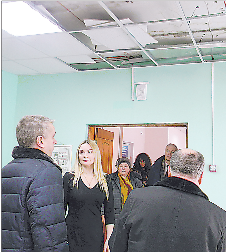
Ремонт в ДДТ «Мастер» сделали не так давно, но качество его – ниже всякой критики

уютный и удобный, был бы, наверное, украшением в любом другом поселении района, за исключением самых крупных, но для тридцатитысячного рабочего посёлка он давно уже мал, и, если бы не используемый по договоренности с Сибирским федеральным научным центром агробиотехнологий зал Дома ученых, то, наверное, проблема проведения в посёлке широкомасштабных культурных мероприятий стояла бы в полный рост. Новых культурных объектов не сдавалось уже много лет. Могут сказать, что у краснообцев завышенные требования по этой части (как, впрочем, и в других отношениях). Только стоит ли их понижать в свете дальнейшего развития рабочего посёлка в рамках Новосибирской агломерации и проекта «Академгородок-2.0»?