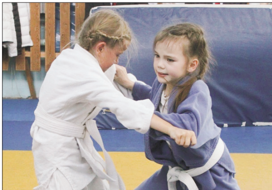
Девочки не уступали мальчишкам в азарте и стремлении к победе