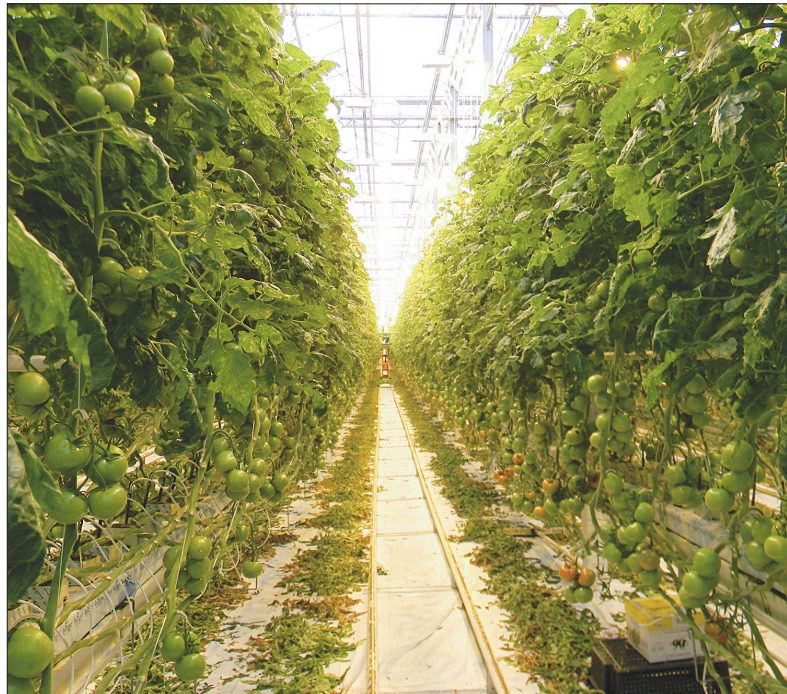
Новосибирская область сегодня полностью обеспечивает себя овощами закрытого грунта

Какие перспективы развития овощеводства у нас в ближайшие годы? Конечно, уже нет и возможности, и потребности, и платежеспособного спроса при столь взрывном росте производства тепличных овощей, чтобы такими же темпами двигаться дальше. Но тем не менее в ближайшие годы будет реализован проект (а его реализация уже началась в текущем году) тепличного комбината «Обской». Будет он не столь масштабным, не столь амбициозным — это шесть гектаров под овощную продукцию закрытого грунта. Объемы производства — порядка 8 тыс. тонн в год. В любом случае, исходя из баланса, из объемов, мы уже будем обязаны вывозить часть продукции за пределы нашего региона. В планах стоит сдача «Обского» уже в текущем году. Объем инвестиций — 1 млрд 200 млн рублей. Во сколько обошлись нам другие тепличные комбинаты? Сумма по «Ново-