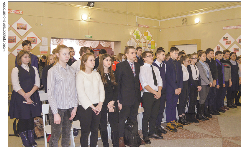
Минутой молчания почтили память ленинградцев, погибших в годы блокады

Во время блокады многие вели дневники, куда по свежим следам записывали то, что пережили.