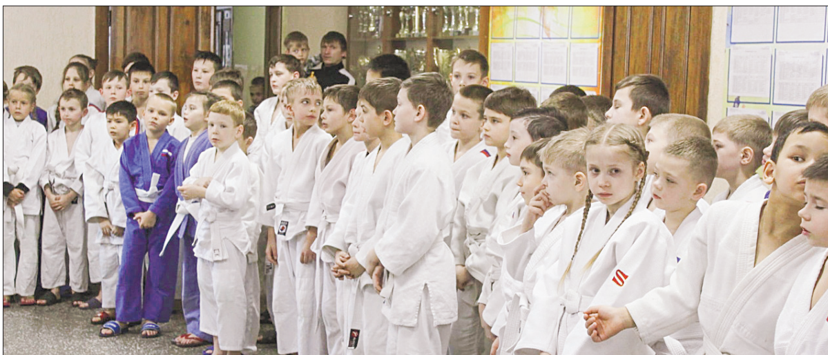
На Кубке Деда Мороза по дзюдо и сумо ребята, которые только начинают заниматься спортом, могут почувствовать, что такое соревнования