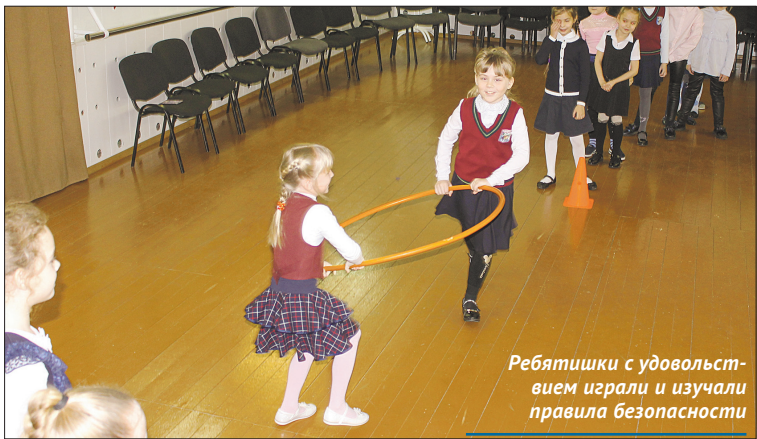
Ребятишки с удовольствием играли и изучали правила безопасности

В конце программы Звезда вручила ребятам полезные подарки, и настроение еще больше улучшилось.