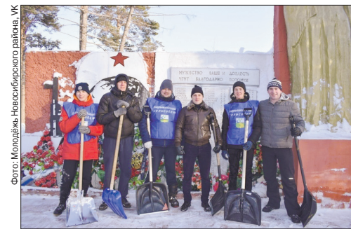
В Барышево «Снежный десант» уже успешно борется с осадками

«Снежный десант РСО» – это молодежная добровольческая акция, направленная на развитие добровольчества в молодежной среде, профориентацию и содействие трудоустройству молодежи, создание условий для реализации потенциала молодежи в