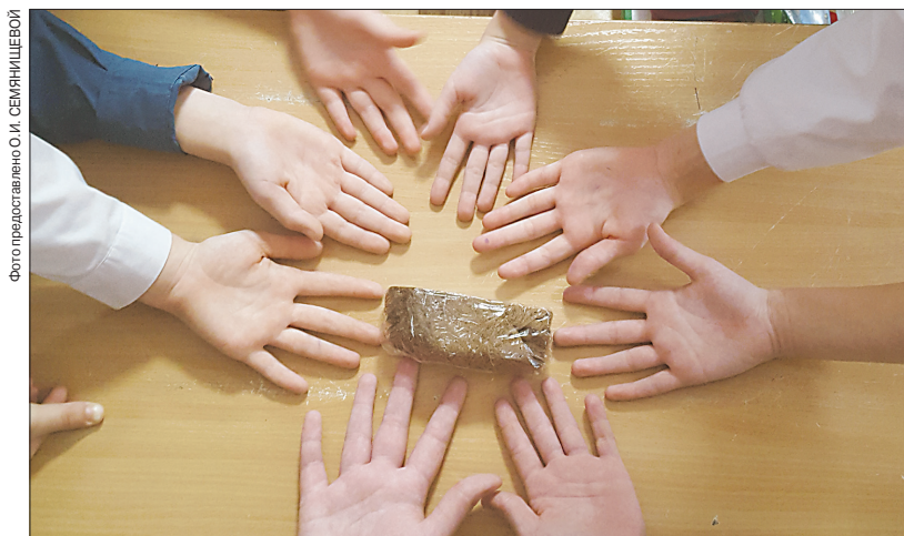
Дневная норма блокадного хлеба была чуть больше детской ладони

В ходе памятных мероприятий учащиеся узнали почти о девятистах днях мучений, боли, страданий, мужества и самоотверженности людей. Ребята с огромным интересом смотрели видеоблок, подготовленный на основе рассказов жителей блокадного города и архивных фотографий. Почтили память погибших в блокаду минутой молчания. Собирали память-пазлы — картинки разрушенных памятных зданий Ленинграда.