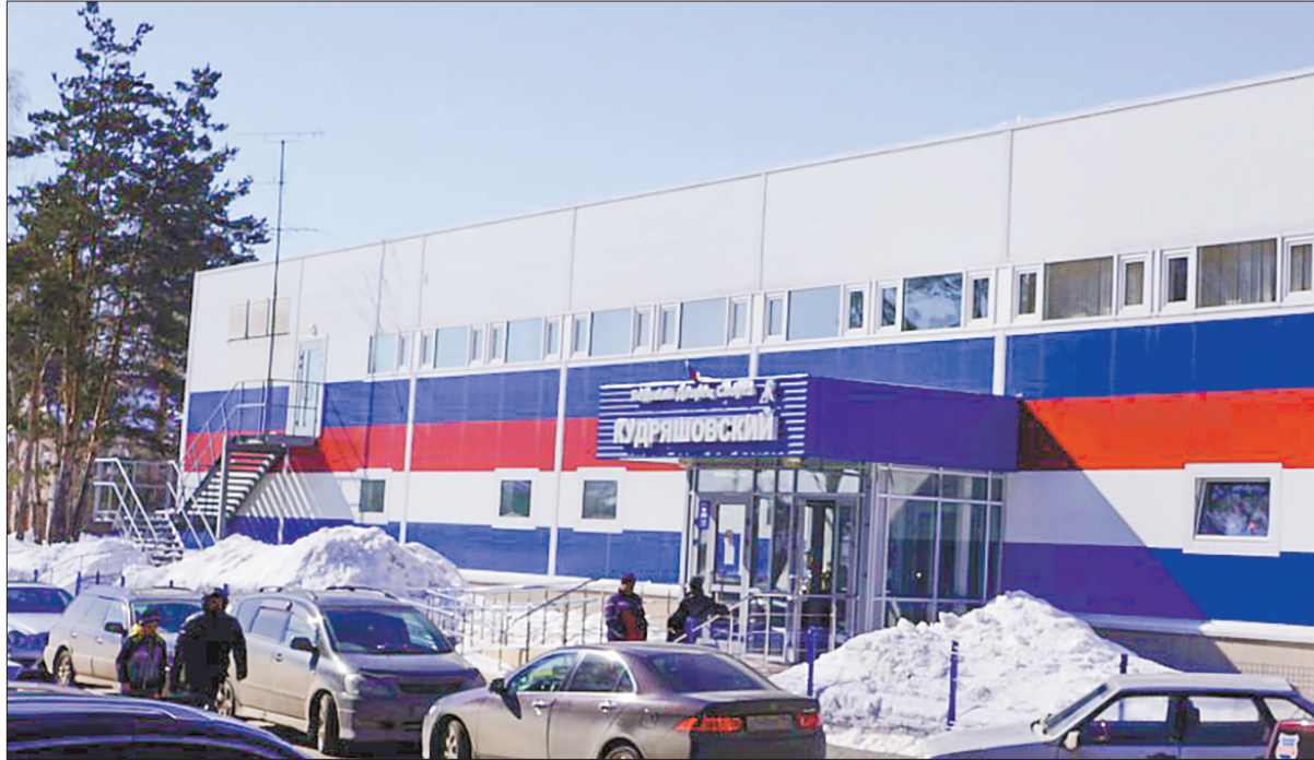
Ледовый дворец спорта стал одной из площадок рабочего визита в п. Кудряшовский