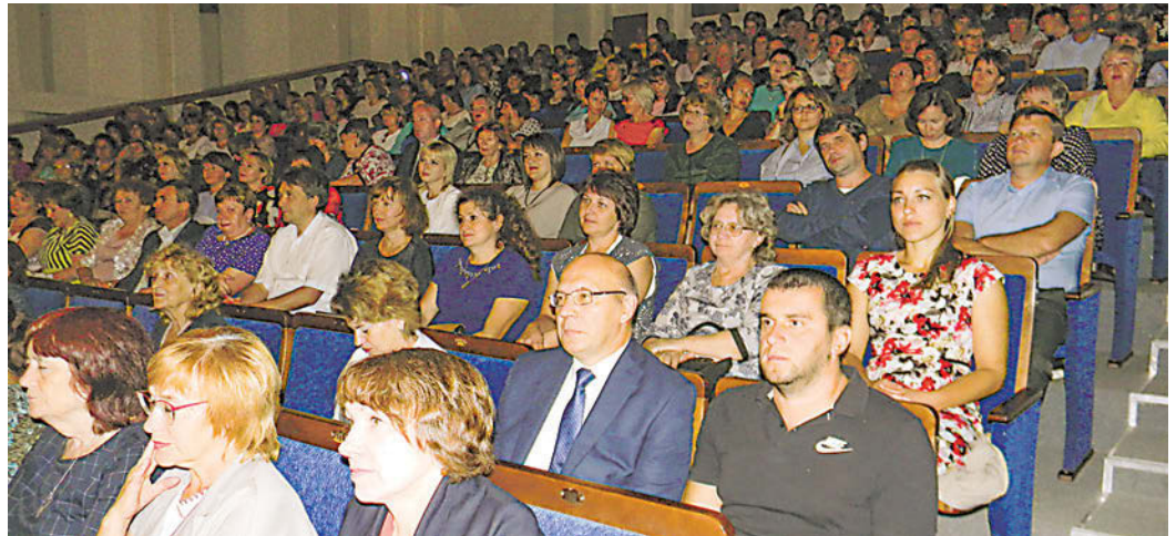
Проблема кадрового обеспечения образовательной системы района продолжает оставаться актуальной

В Краснообске в Доме ученых прошел XI августовский форум педагогических работников Новосибирского района «Реализация национального проекта «Образование» на муниципальном уровне. Новые задачи, новые возможности».