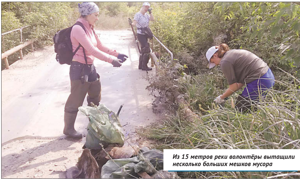
Из 15 метров реки волонтеры вытащили несколько больших мешков мусора