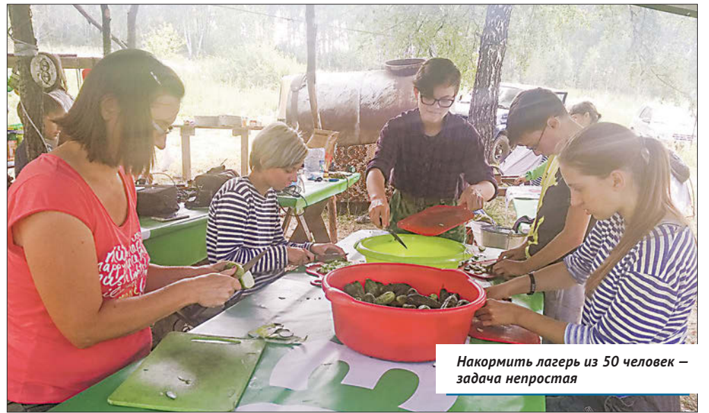
Накормить лагерь из 50 человек — задача непростая

В девятый раз в Новосибирском районе прошла смена экологического волонтерского лагеря «Живая Издревая»: участники проекта очищали от мусора территорию Новолуговского и Раздольненского сельсоветов.