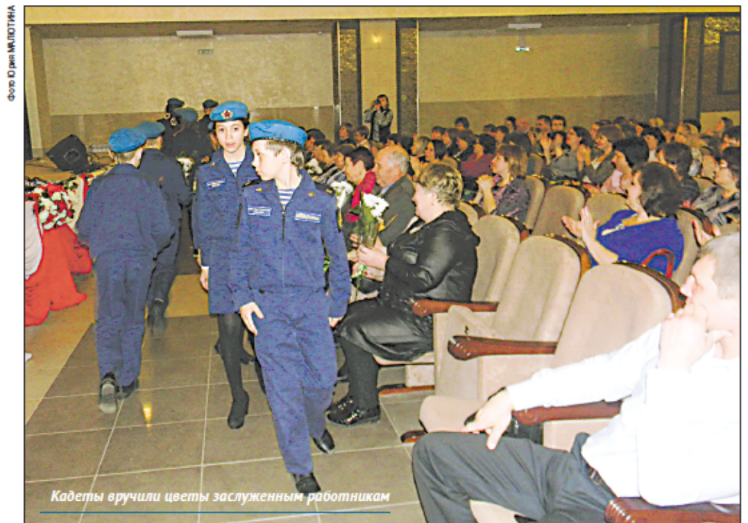
Кадеты вручили цветы заслуженным работникам

Собрания педагогов района, по каким бы поводам они ни проводились, всегда находятся в зоне особого внимания. Хотя бы потому, что на образование – по части средней школы отрасль сугубо государственную – уходит около 70% средств районного бюджета, и это требует соответствующего к себе отношения.