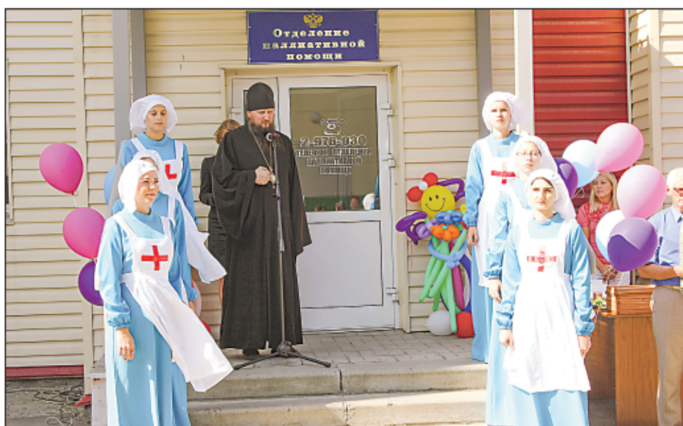
С момента открытия в 2014 году выездные бригады паллиативного отделения посещают ежедневно 7–10 больных на дому

Пациентам на дому помогают выездные паллиативные бригады. Их на базе отделения четыре — две взрослые и две детские. Ежедневно каждая посещает 7–10 точек, за год бригады сделали 7 тыс. выездов: 3000 к детям, 4000 к взрослым. Они помогают родственникам паллиативных больных с уходом и оказанием медицинской помощи, корректируют обезболивание, оказывают психологическую поддержку, обучают мам работе с аппаратами ИВЛ.