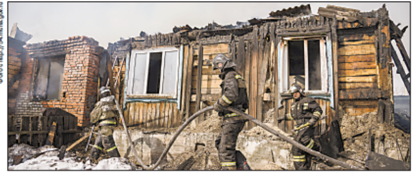
Огнем было объято 350 квадратных метров