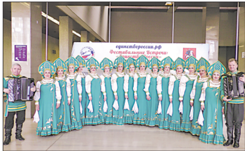
Хор русской песни «Светлица»