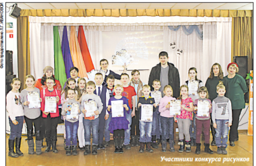
Участники конкурса рисунков

В этот день было награждено 30 участников конкурса. 16 ребят получили грамоты за участие