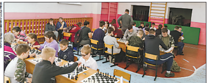
Межрайонный турнир может стать традиционным