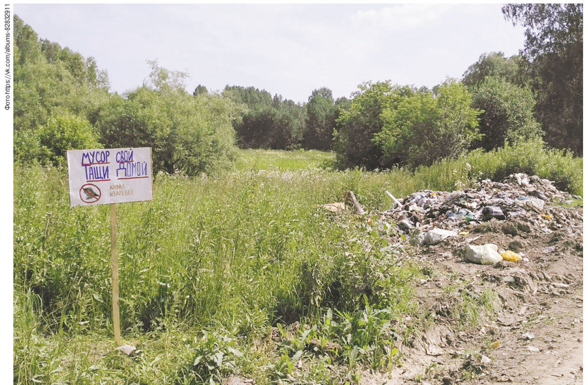
Если не решить вопрос вывоза мусора из дачных обществ, летом нас может ждать такая картина