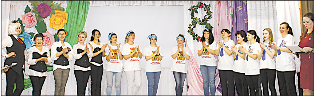
«А ну-ка, девушки!» прошли на одном дыхании