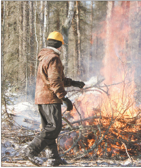
В прошлые годы в Новосибирском районе удавалось потушить все возгорания за один день

Новосибирское лесничество, расположенное на территории Кудряшовского сельсовета, проверили на готовность к пожароопасному периоду. В правительстве области утверждают: сделано все необходимое, чтобы не допустить распространения огня.