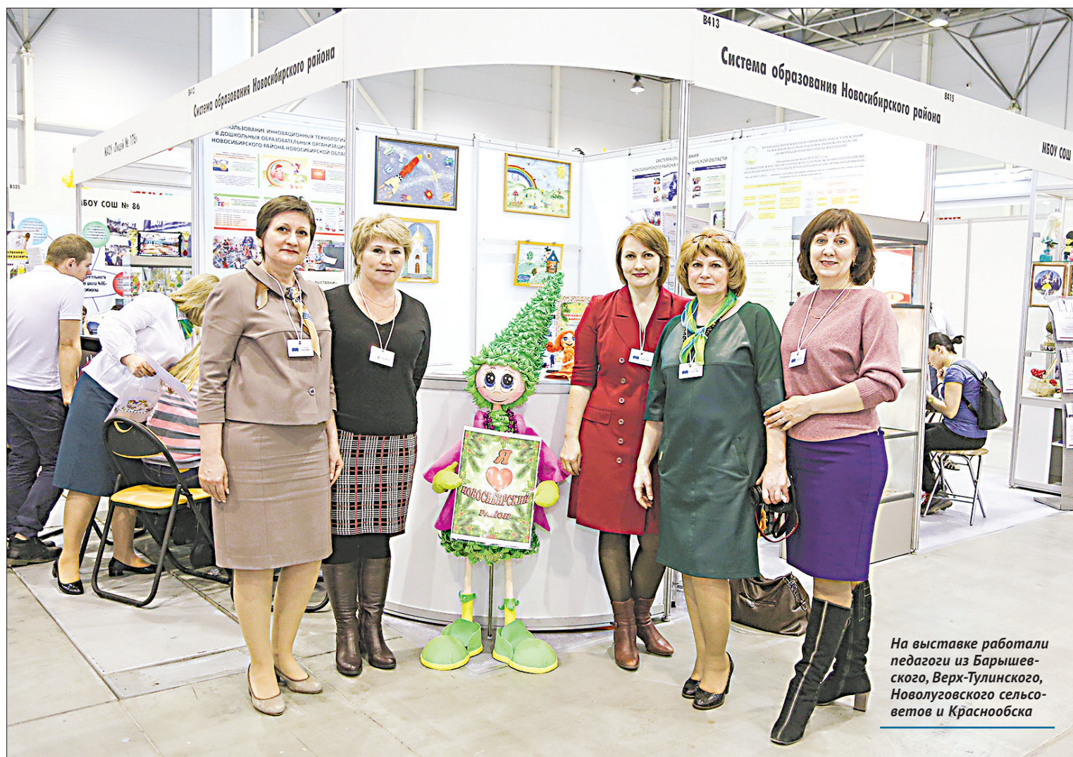
На выставке работали педагоги из Барышевского, Верх-Тулинского, Новолуговского сельсоветов и Краснообска