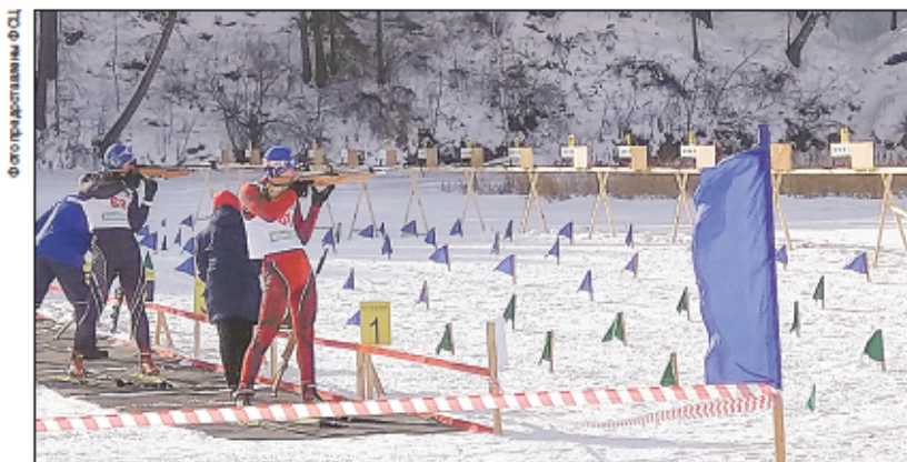
В командном зачете наши биатлонисты – четвертые