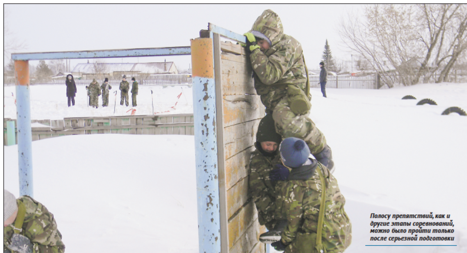
Полосу препятствий, как и другие этапы соревнований, можно было пройти только после серьезной подготовки

В нашем районе на базе новошиловской средней школы №82 прошла районная военно-спортивная игра «Зарница».