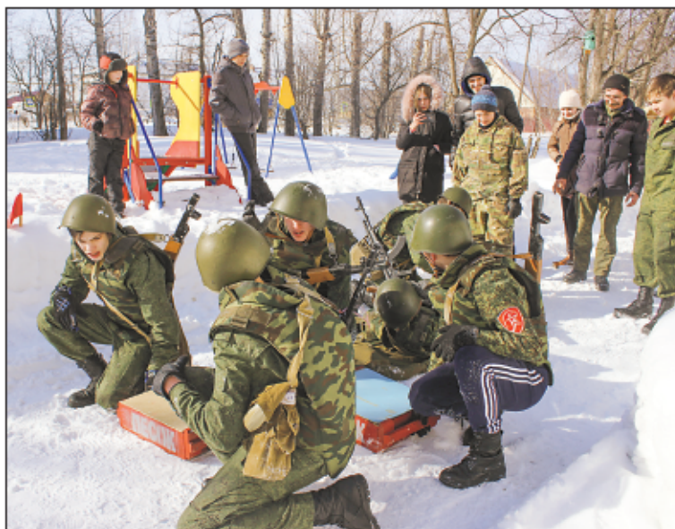
Команды продемонстрировали смелость, хорошую подготовку и взаимовыручку

Не так просто было состязаться в стрельбе, в разборке и сборке автомата Калашникова, снаряжении автоматного магазина