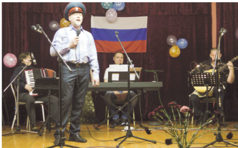
ВИА «Боевой курс»

Говорили и про мужество воинов-интернационалистов. Многие присутствующие в зале с удивлением узнали, что совсем рядом с нами, в нашем Мичуринском сельсовете, живут герои — участники боевых действий в Чечне, Афганистане, Северной Осетии, ликвидаторы аварии на Чернобыльской АЭС — скромные и про-