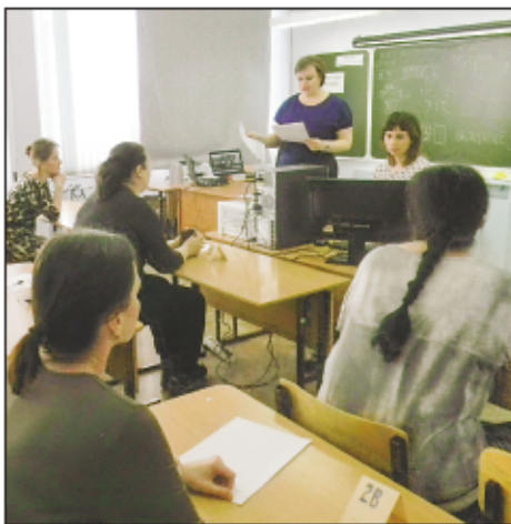
На родительском ЕГЭ все было так же серьезно, как и на обычном