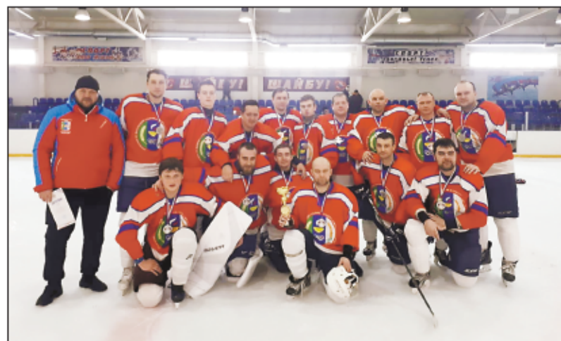
Хоккеисты стали серебряными призерами