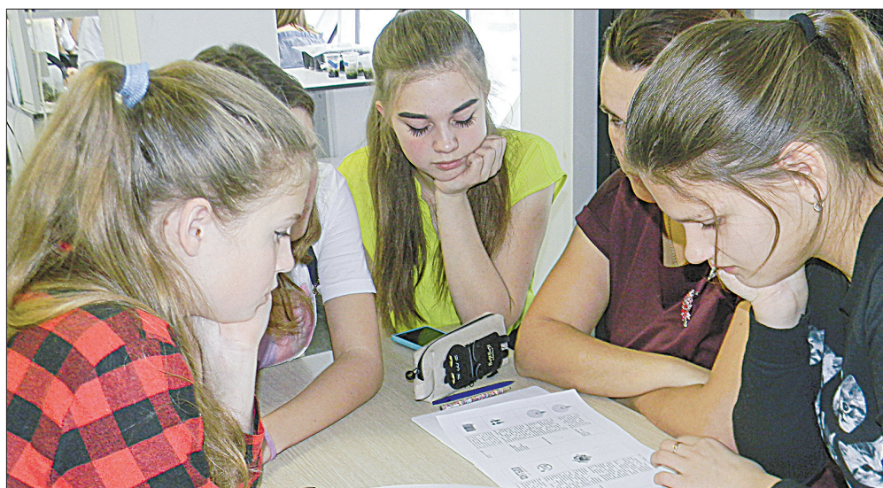
Школьные команды за определённое время должны были создать свои проекты

«Сердце» детского БТП – его ресурсный центр, в котором и проходил сбор школьников, участвующих в Российском движении школьников (РДШ) – движении, с каждым годом набирающем обороты. Большое (если не сказать, колоссальное) представительство на этом сборе имели школы нашего Новосибирского района, работающие под эгидой РДШ – 60 участников из 70-75. Это юные березовцы, барышевцы, кудряшовцы, краснообцы, жеребцовцы, издревинцы, толмачевцы, гусинобродцы. Оставшиеся участники – кольцовские школьники. Вот с ними-то и решили объединить усилия наши ребята и их руководители, чтобы обмениваться опытом, развивать совместные проекты в рамках РДШ – чтобы стать еще сильнее, дать новые импульсы движению. Конечная цель которого – при строгой дисциплине соблюдения принципа добровольности – сделать движение по-настоящему массовым. Разумеется, хотя бы приблизиться к той массовости, что была в советской школе (имеется в виду пионерская организация), вряд ли получится. Да и это и не нужно, и нет такой задачи, нет