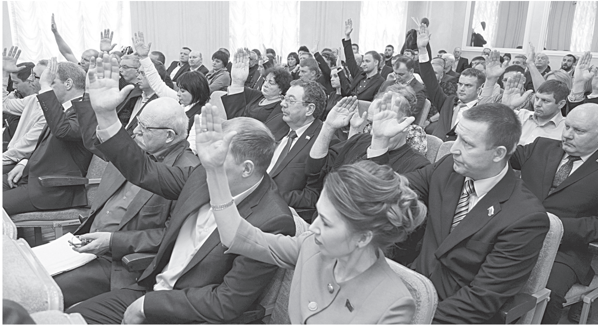
Единогласных решений на сессиях становится все меньше

Первостепенным вопросом 29-й сессии был вопрос исполнения бюджета за девять месяцев