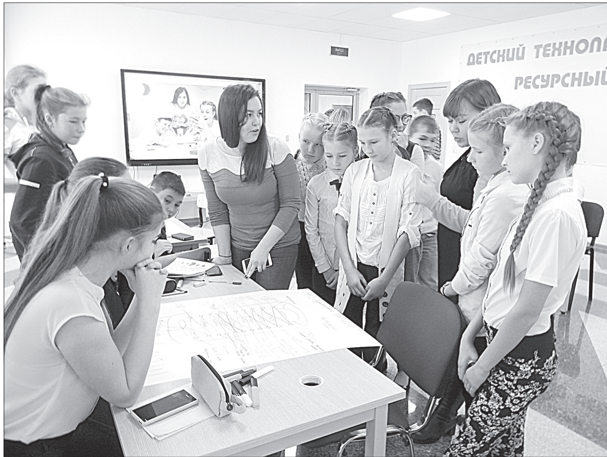
16 образовательных учреждений района развивают движение школьников

— Наше движение действительно набирает обороты, и мы счастливы побывать на мероприятии муниципального штаба... даже двух муниципальных штабов, Новосибирского района и р.п.