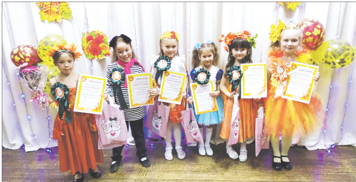
Участницы конкурса «Мисс осень — 2018»

Первым этапом был конкурс «Самопрезентация». Девчата в шуточной форме рассказывали о себе. Мы сидели в зале и молча удивлялись, откуда, как говорится, что берется? Просто поселок, про-