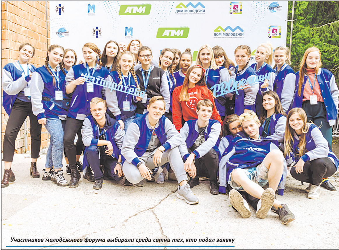
Участников молодёжного форума выбирали среди сотни тех, кто подал заявку