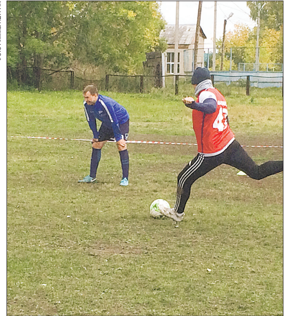
На небольшом поле всё было по-настоящему