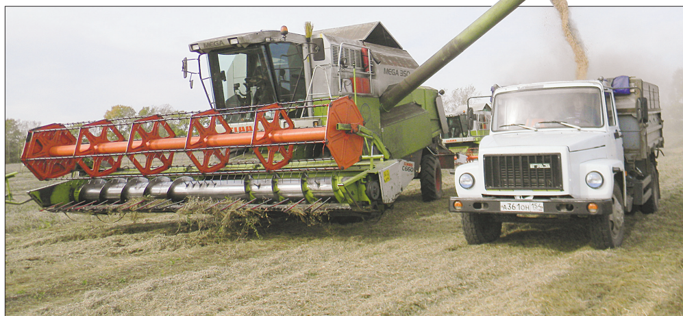
На больших площадях растения положило ветром, убирать их особенно трудно

– Финансовых возможностей недостаточно. Потому что цены на запчасти и на горючее... сами знает, какие. Вот последний