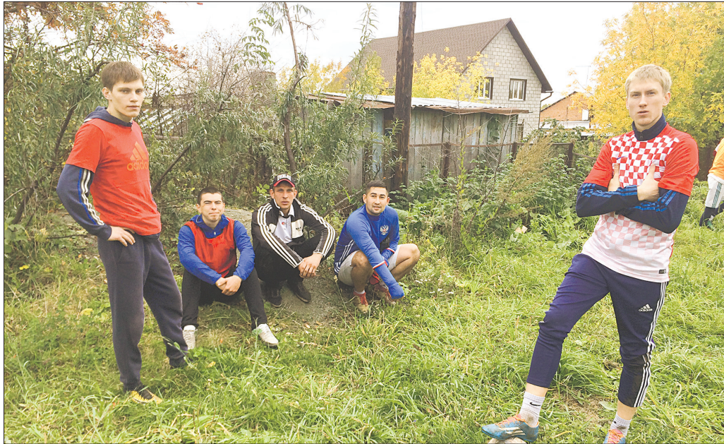
Команда из Верх-Тулы

В субботу, 22 сентября, Бог позаботился и о спортсменах, и о погоде. Ясный, теплый и прозрачный осенний день был пропитан желто-багряными красками, запахом увядающей листвы и свежескошенной травы. К турниру готовились. Ровная площадка за школой была аккуратно разделена на два поля красными лентами. По краям стояли скамейки для болельщиков, на которых стайками угнездились убежавшие с уроков мальчишки, похожие на взъерошенных воробьёв. Рядом скромно стояли малочисленные девчонки, изо всех сил пытавшиеся вникнуть в происходящее.