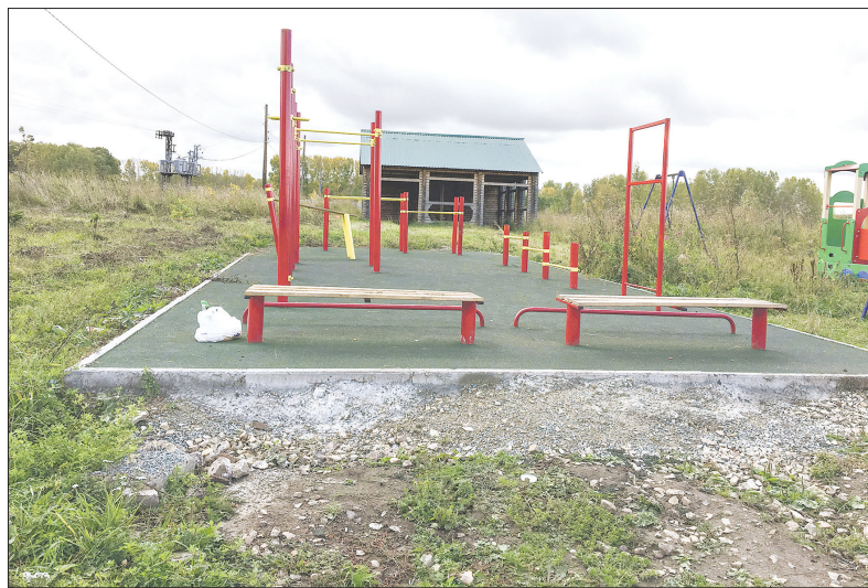
... и даже на новой детской площадке — мусор

— Ох, сейчас я вам и про питьевую воду расскажу. Она у нас не соответствует качеству. У нас есть заключение экспертов от 2014 года и решение суда, где предписано обеспечить посёлок питьевой водой. Из местного бюджета нереально выкроить деньги на решение этой беды.