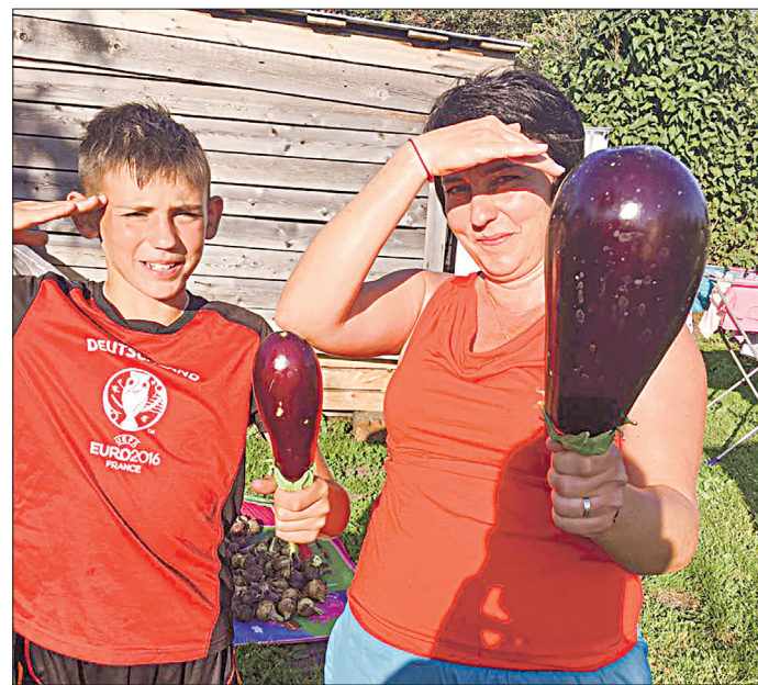
Вот такой баклажан-гигант вырастила семья Бондарь на ст. Мочище