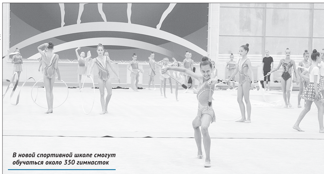
В новой спортивной школе смогут обучаться около 350 гимнасток

трех тысяч человек, причем 44 спортсмена имеют звание «Мастер спорта России».