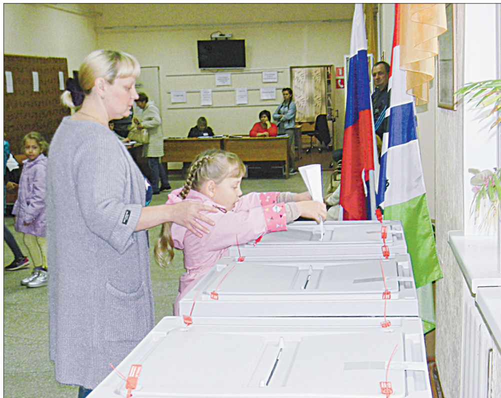
Дети явно гордились оказанным им взрослыми доверием – опустить бюллетень в урну