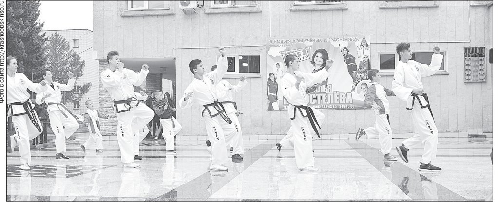
Выставка услуг дополнительного образования может стать в Краснообске традиционной

В начале сентября возле Дома культуры прошла выставка услуг дополнительного образования детей «Интеллект. Творчество. Спорт».