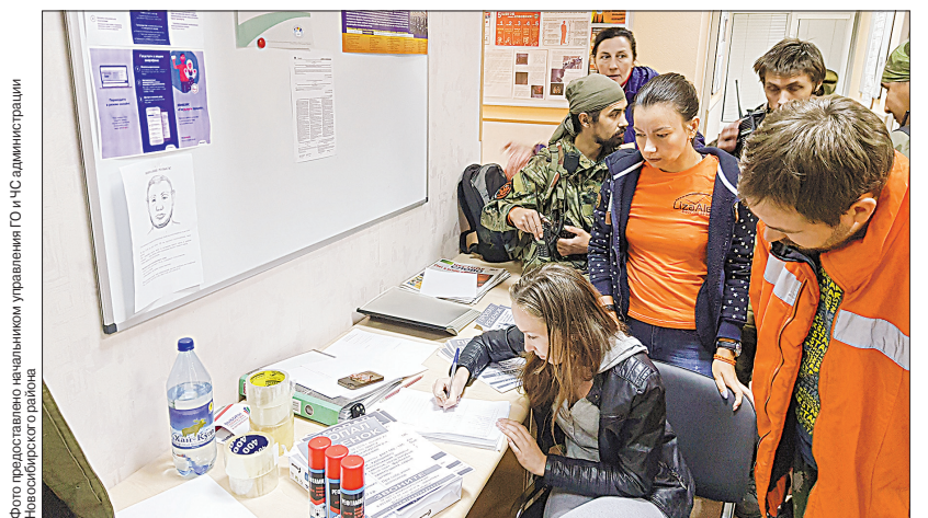
В последний раз в Толмачевском мальчика, ушедшего из дома, искали 60–70 человек