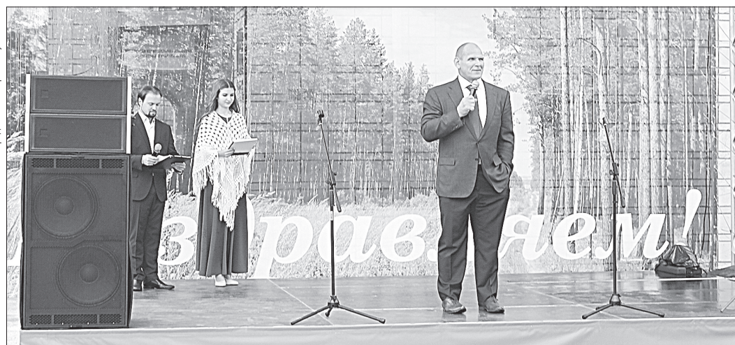
Александр Карелин приехал поздравить кудряшовцев с днём рождения посёлка

образования и трудятся на его благо. Среди них самые юные жители поселка и долгожители, молодожены, семьи, прожившие в браке много лет, активисты поселка. Награждались участники конкурсов, организованных СКО д.п. Кудряшовский в преддверии праздника, участники и победители соревнований, проводимых ДЮСШ «Чемпион».