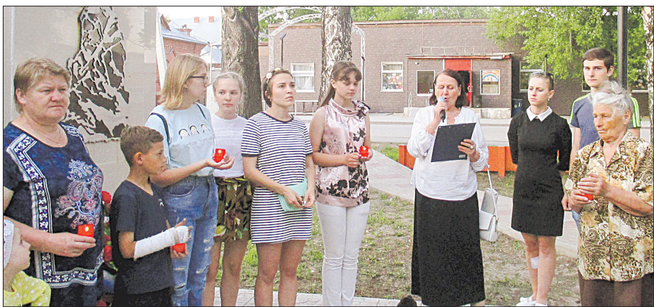
Свечи памяти загорелись 22 июня на ст. Мочище