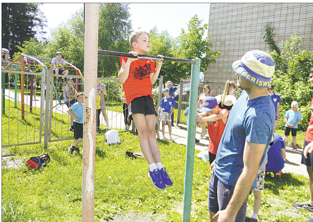
Судьи не давали юным спортсменам поблажек при выполнении упражнений