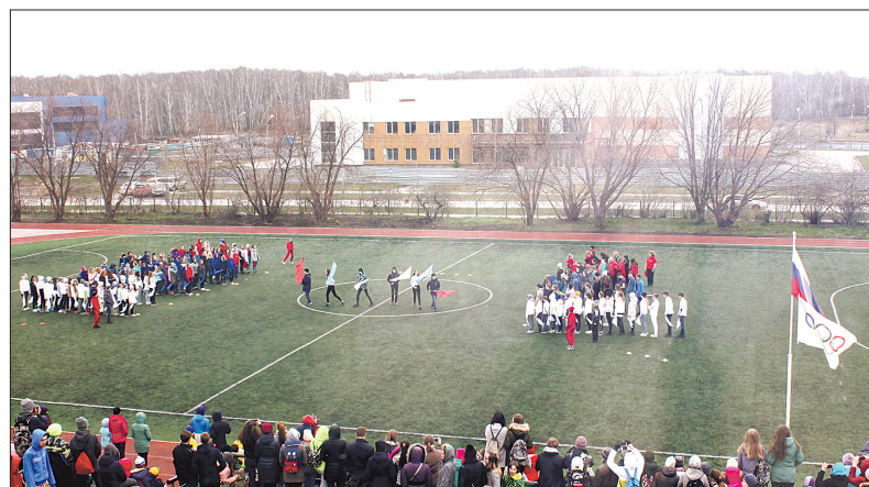
Флешмоб превратился в масштабное зрелище

пистолетом и битой проходили под аплодисменты. Были приглашены организации, занимающиеся патриотическим воспитанием молодежи. Это муниципальный военно-патриотический клуб «Зенит», военно-спортивная школа «Союз» центра дополнительного образования «Алые паруса», православный патриотический клуб «Ковчег». Ученики могли примерить обмундирование российских воинов разных эпох, собрать и разобрать автоматы, найти в приделах винтовок и гра-