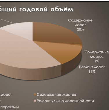
Отчёт о выполнении годового плана в процентном отношении

Администрацией Новосибирского района Новосибирской