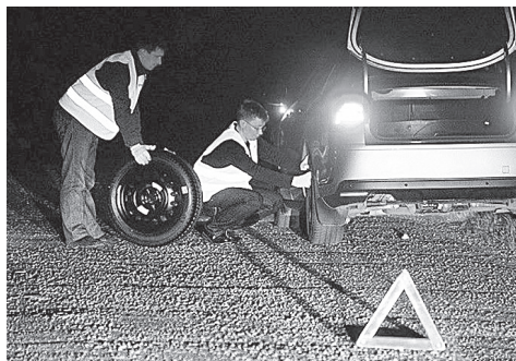
Водителя, одетого в светоотражающий жилет, хорошо видно даже в темноте

18 марта в России вступили в силу поправки в Правила дорожного движения. Согласно нововведениям, выходить из машины в темное время суток или в условиях ограниченной видимости можно только в световозвращающем жилете.