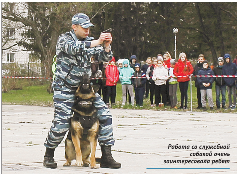
Работа со служебной собакой очень заинтересовала ребят

Гостями и главными действующими лицами мероприятия стали управление по контролю за оборотом наркотиков ГУ МВД России по Новосибирской области, отряд специального назначения «Гром», кинологовая служба ГУ УВД. Событие было интересным и захватывающим. Детей особенно взволновало, найдет ли специаль-