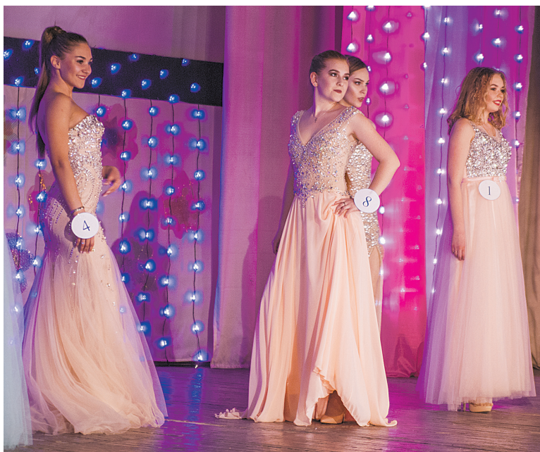
Все участницы конкурса были достойны самых высоких наград

В этом году было введено новшество — проголосовать за «Мисс зрительских симпатий» можно было уже в фойе Дома ученых. Группы поддержки каждой из девушек организовали мини-презентации для гостей мероприятия — кого-то поддерживали при помощи ярких плакатов, кого-то — стилизованным столом с самоваром и сладостями.