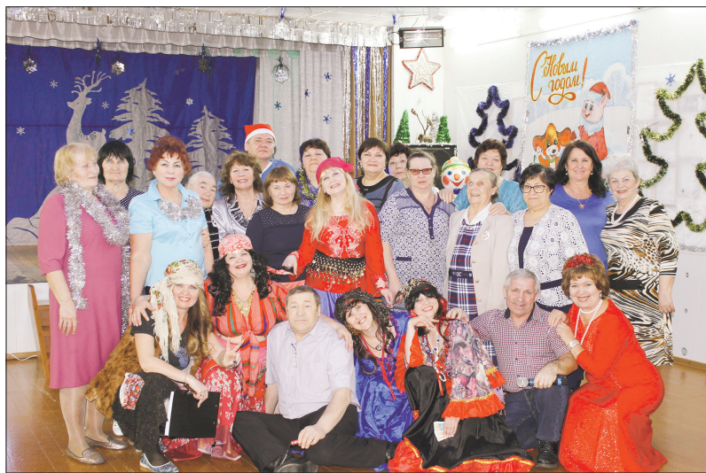
Все без исключения остались довольны праздником и благодарили организаторов за чудесный вечер

Методист МКУ «СКО д.п. Кудряшовский» В. ШУЛЬГА