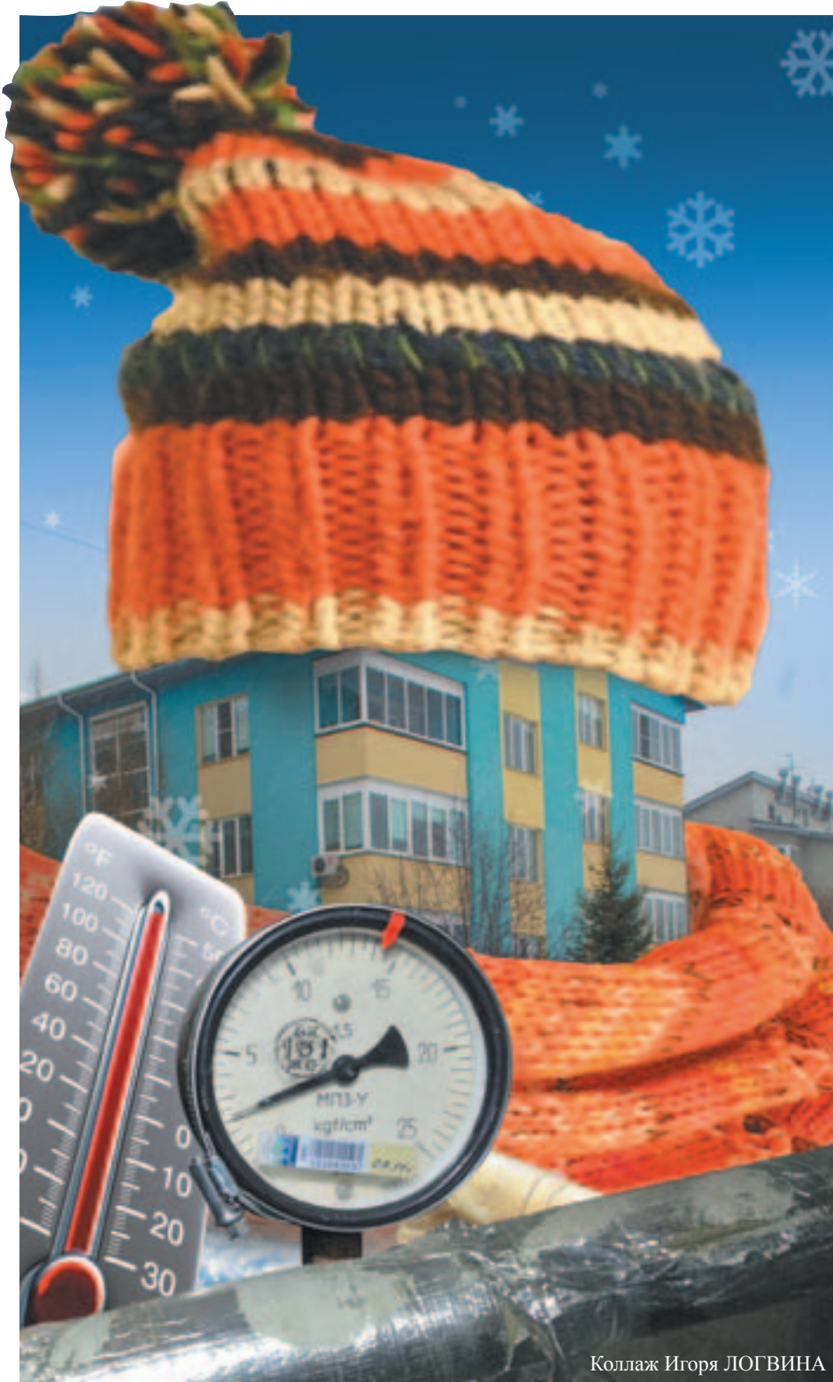
Коллаж Игоря ЛОГВИНА