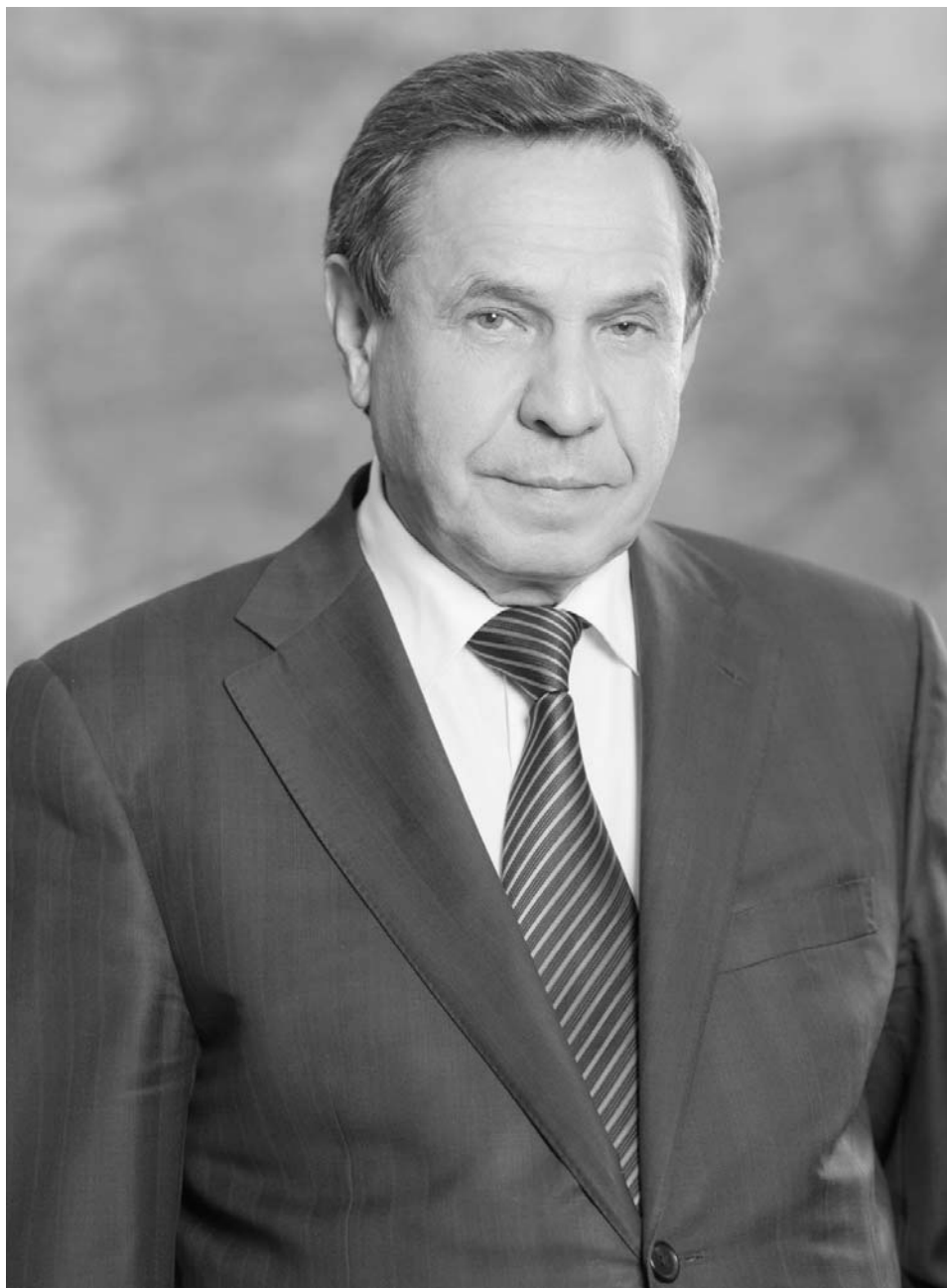
Опубликовано бесплатно в соответствии со статьей 44 Закона Новосибирской области от 28 июня 2012 г. № 243-ОЗ «О выборах Губернатора Новосибирской области» по договору о предоставлении бесплатной печатной площади для проведения предвыборной агитации

Собрание областного общественного движения «Наш Губернатор» завершилось принятием обращения его участников к жителям Новосибирской области. «Мы хотим, чтобы наша область прочно заняла место среди экономически стабильных, передовых регионов страны, а жители гордились своей малой родиной, – говорится в этом документе. – Мы призываем тех, кто разделяет наши взгляды и готов работать на благо людей в Новосибирской области, присоединиться к нашему движению и поддержать Владимира Филипповича Городецкого. Вместе мы победим!»