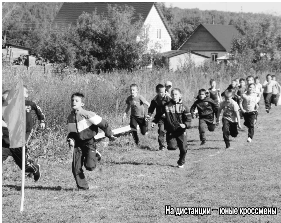
На дистанции – юные кроссмены