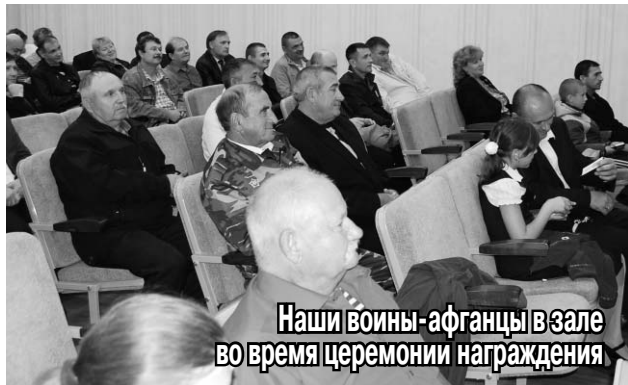
Наши воины-афганцы в зале во время церемонии награждения

К поздравлениям официальных лиц в честь награжденных медалью «25 лет вывода советских войск из Афганистана» присоединились лучшие артисты и музыканты района — в честь наших воинов-афганцев был дан концерт.