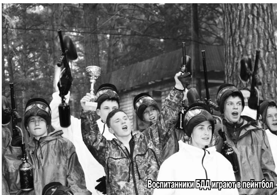
Воспитанники БДД играют в пейнтбол

Сотрудники Управления ФССП России по Новосибирской области устроили настоящий праздник для воспитанников Барышевского детского дома.