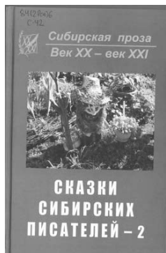
СКАЗКИ СИБИРСКИХ ПИСАТЕЛЕЙ - 2

«Сказки сибирских писателей — 2» и другие сборники серии «Сибирская проза. Век XX — век XXI» вы можете прочитать во всех библиотеках района.