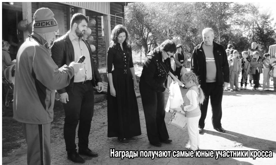
Награды получают самые юные участники кросса