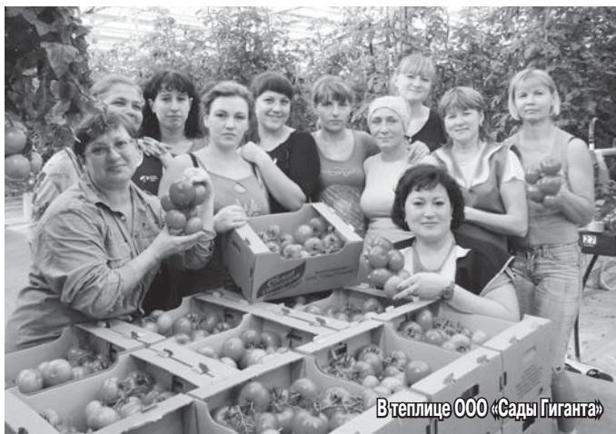
Ветлице ООО «Сады Гиганта»

Новосибирский район был основан в 1939 году. На тот момент на территории района располагалось 44 колхоза.