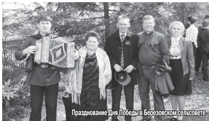
Празднование Дня Победы в Березовском сельсовете