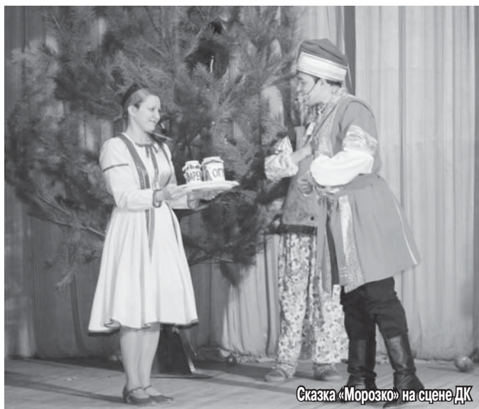
Сказка «Морозко» на сцене ДК