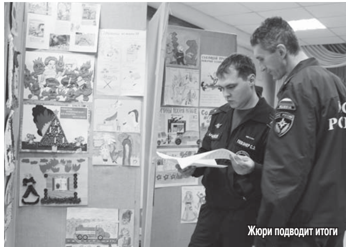
Жюри подводит итоги

В доме детского творчества «Мастер» был проведен районный конкурс «Сохрани жизнь и здоровье».