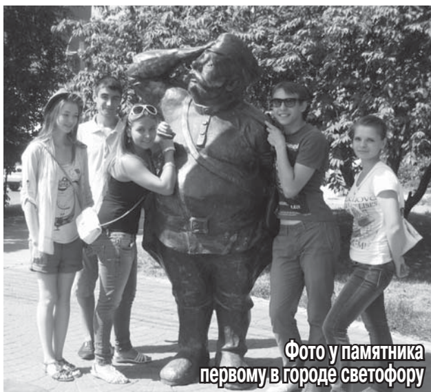
Фото у памятника первому в городе светофору

На прошлой неделе по инициативе отдела молодежи Новосибирского района для школьников и студентов наших поселений была организована ознакомительная экскурсия по Новосибирску.