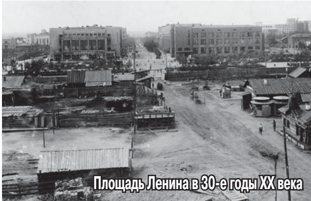
Площадь Ленина в 30-е годы XX века